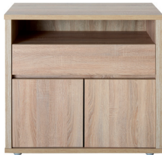
FR 7 824 x 895 x 405 mm