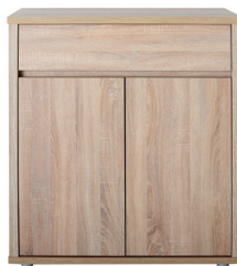
FR 11 975 x 895 x 405 mm