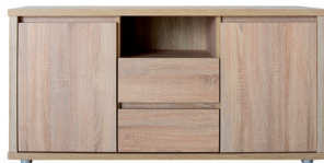
FR 10 606 x 1301 x 405 mm