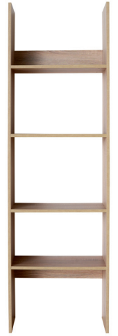
FR 4 1915 x 576 x 296 mm