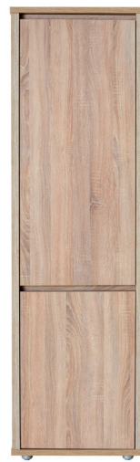
FR 3A B/J 1976 x 586 x 405 mm polcos szekrény