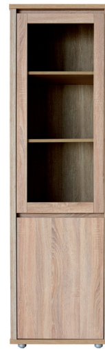
FR 3Ü B/J, FR 3NY B/J 1976 x 586 x 405 mm FR 3NY - nyitott szekrény