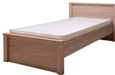
R12 828 x 1110 x 2106 mm fekvőfelület: 900 x 2000 mm