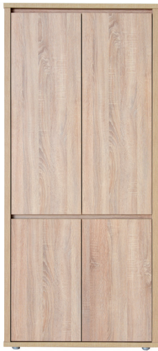
FR 2A 1976 x 895 x 405 mm polcos szekrény