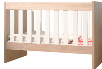
FR 12 840 x 1456 x 762 mm állítható magasság, levehető első rács