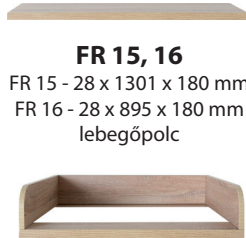
FR 15, 16 FR 15 - 28 x 1301 x 180 mm FR 16 - 28 x 895 x 180 mm lebegőpolc