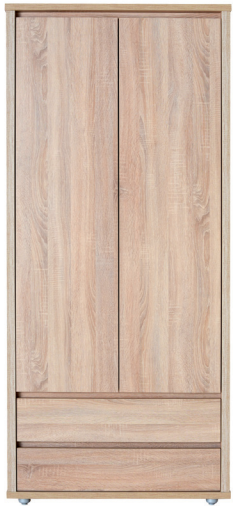
FR 1 1976 x 895 x 545 mm fiókos, akasztós szekrény