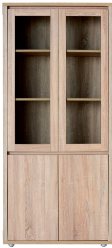
FR 2Ü, FR 2NY 1976 x 895 x 405 mm FR 2NY - nyitott szekrény