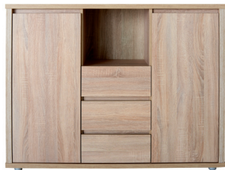
FR 9 975 x 1301 x 405 mm