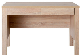
R18 750 x 1154 x 672 mm