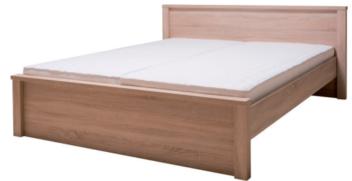
R14 - 828 x 1810 x 2106 mm - fekvőfelület: 1600 x 2000 mm